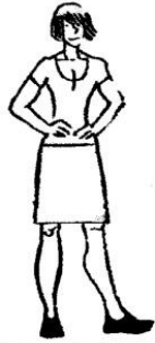
a tall, thin, muscular woman