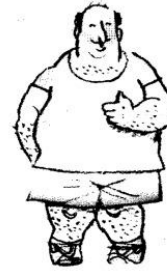
a short, fat, bald man